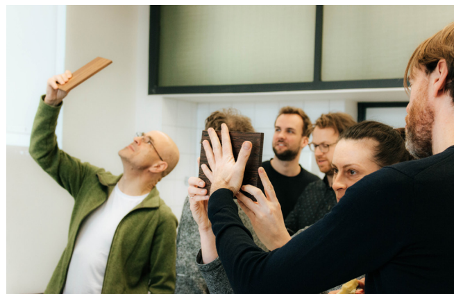
Bild: Material-Innovations-Workshop am Fachbereich Architektur der TH Köln (2020). Geplant und moderiert vom Team materials.cologne.